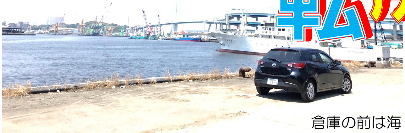
倉庫の前は海・・・

この度、福岡営業所を糟屋郡新宮町から、中央区那の津へ移転することとなりました。今度の営業所は、300坪の平倉庫付きです。半年ぐらい前から、探していましたが、やっと契約できて、移転することができるようになりました。 以前の営業所では、増車ができなくなっていたので、新営業所です更に事業拡大できるように準備しています。300坪の倉庫ですが、市内に近くインターチェンジも近いことから引き合いも多いです。 グループ会社の福岡進出の後押しも、この倉庫のおかげでできるようになりました。 もし、ご興味がある方がいらっしゃいましたら、お早めにお問い合わせください！