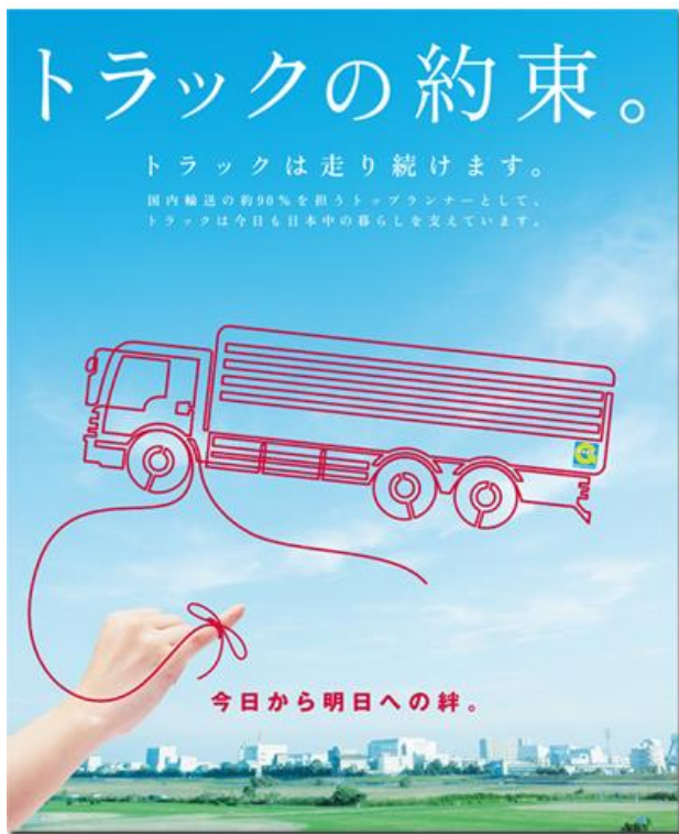
平成25年度のポスター